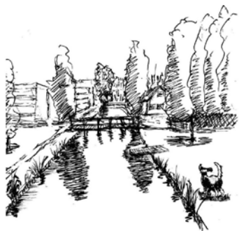
Een ontmoetingsplaats voor honden. Tekening Johan Meus

Purmerend won uiteindelijk brons bij de wedstrijd Nationale Groenprijs. De jury complimenteerde de gemeente voor de betrokkenheid van de inwoners en het goede contact tussen hen en de gemeente: 'Krachtig is de visie van de gemeente Purmerend op het betrekken van bewoners bij het groen. Bewoners dragen zorg voor een aantrekkelijke, groene straat en daarmee ook voor een sociaal vriendelijk klimaat.'