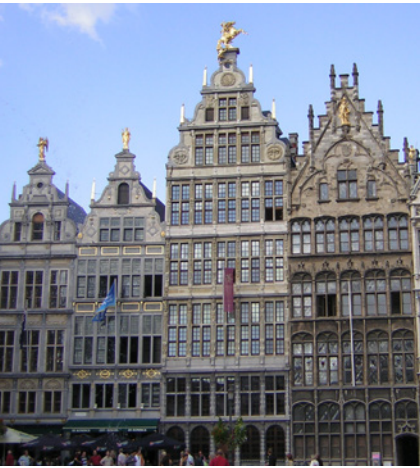
Gildehuizen aan de Grote Markt in Antwerpen.

In onze wijk hebben we het Gildeplein, maar waarom heet dit eigenlijk zo? Hieronder krijgt u de nodige uitleg.