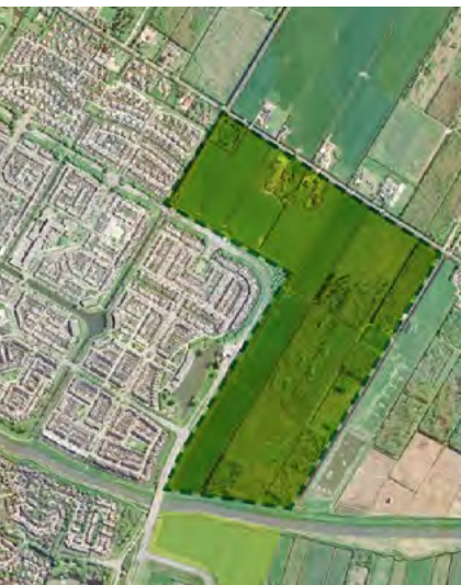
Overzichtskaart Purmer-zuid zuid

een mooie inpassing in het naastgelegen landschap. Een mooie wijk waar plaats is voor iedereen, ongeacht de grootte van de portemonnee. We staan pas aan het begin van dit proces en het gaat nog jaren duren voordat daar kan worden gewoond, maar het belooft een prachtige wijk te worden.