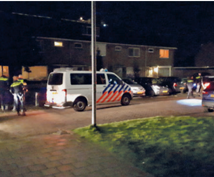
Politie houdt inbrekers aan.

De wijkagenten van Overwhere geven hieronder een overzicht van enkele zaken die begin dit jaar in de wijk speelden.